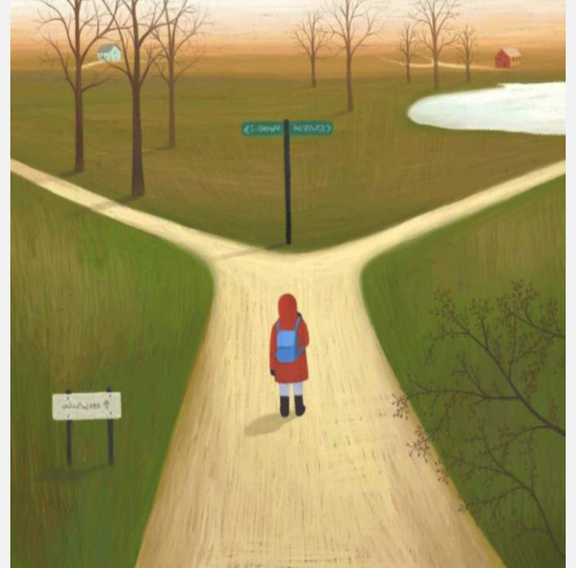
이전 목표 vs. 현재 목표